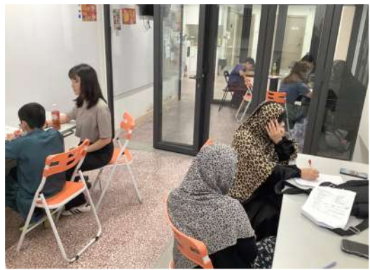
烏都鄰舍中心 - 小數族裔功輔班