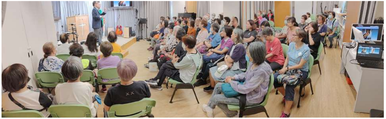
樂齡薈 - 痛症講座

教會新進兩張乒乓波檯，竟也派上用場。話說樂齡薈借場辦乒乓波訓練，我們樂見一班樂齡人士活躍地發揮球藝，互相切磋。其中邀請一位樂齡人士來參加福音主日，她一口答應。當日她很專心聆聽福音信息，她當日就歸信了耶穌基督。讚美神！