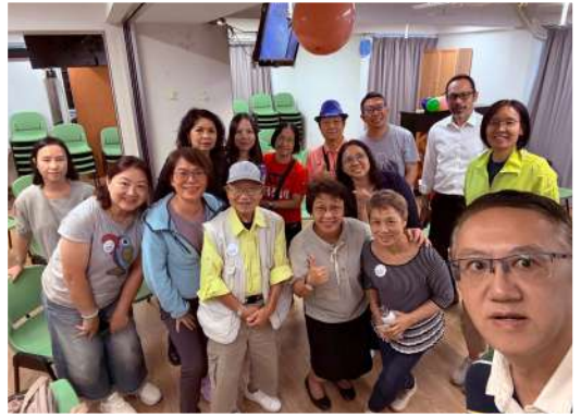
慈孝安老院長者活動義工

神讓我們有機會接觸他們，彼此建立友好關係，他們會好奇主動問我們為什麼會信耶穌？教會在這區多久？教會活動是幾時？…這給了我們好機會向他們分享福音。甚至為憂心忡忡的樂齡人士禱告。一位舞蹈班的樂齡人士，當約她來福音主日時，她從教會照片發現我們的會友是她大學的同學！立刻拉近了彼此的關係，目前她來過兩次福音主日慕道。教會預備的新年福音單張與新年揮春、中信見證刊物等，樂齡人士樂意接受取回家去。