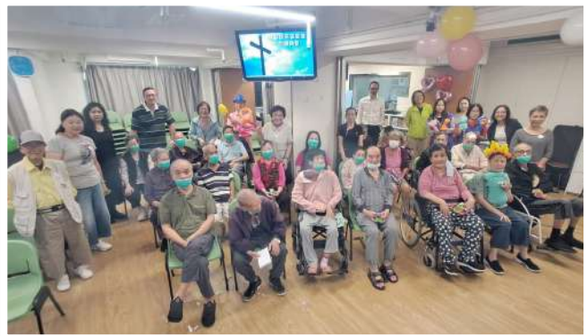
慈孝安老院長者活動

9/11 教會主辦同樂齡薈與建祝義工隊合作舉辦 -- 慈孝安老院長者活動。疫情時和後，安老院不開放外人難進。這日下午見安老院負責人親自領著護工一個個帶著、推著輪椅將院友帶進教會時，這幕令我們非常震撼，是不可能！卻是真實！共廿多位院友護工及我們十五位義工共同渡過了一個充滿著音樂、遊戲歡笑聲、聽生命故仔寧靜反思、鼓勵的溫馨周末。