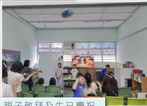
親子敬拜及生日慶祝