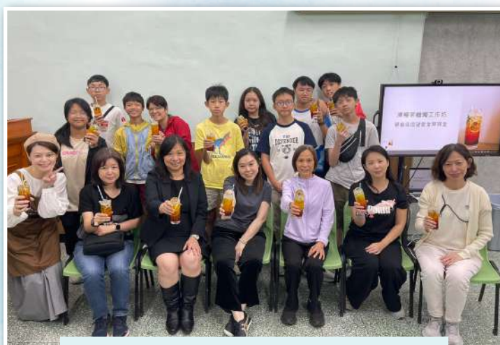
堅樂事工 - 製作檸檬茶蠟燭