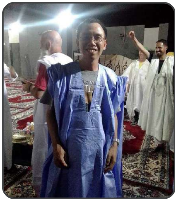
■10月中，有短宣隊前來進行醫療及棒球的服侍，我們獲區域總督設晚宴招待，還送我們每人一件當地的民族服裝。

興趣以前時常多備一次。有時和，為一機讓。今天到家自行東等。的，了分己前西。技，享是一，過。能，便自行步認去。、遇到的見主一年。性格機服步便些，。性。和會侍的讓人主。興。經，我，又。