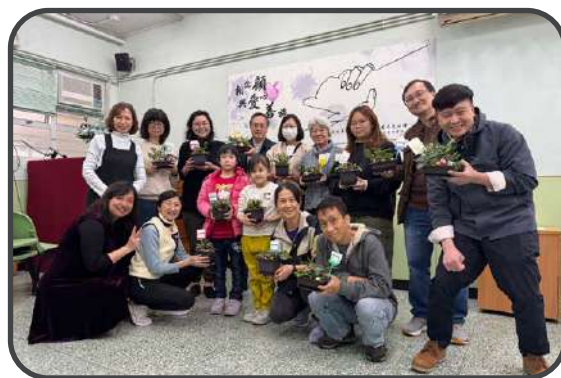
■ 相交活動 - 盆栽製作 ■