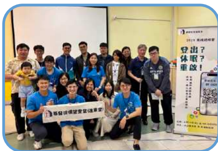
▼ 逸東堂 ▼