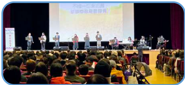
▼ 詩歌敬拜 ▼