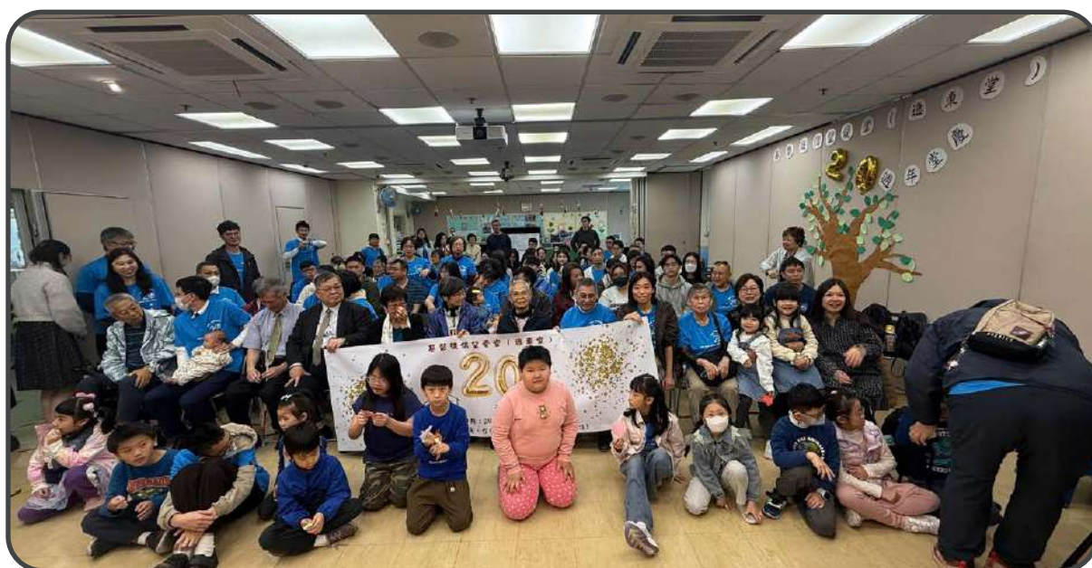
▼ 20 周年堂慶 ▲

過去兩年我們皆集中於扎根部分，盼望為弟兄姊妹在信仰基礎上好好扎根，以面對未來挑戰。新的一年，我們將轉向往上結果部分。要為神結果，就在於我們怎樣在神裏面活出神所喜悅的價值觀。盼望新一年能幫助弟兄姊妹除了認識聖經真理外，還能真正活現在生活中，為神結出佳美果子。