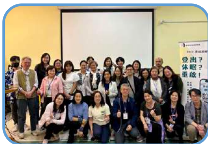
▼ 沙田堂 ▼