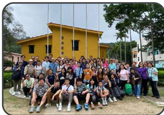
主內一家 - 教會同樂日 2025