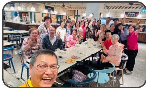
▼ 團友聚餐 ▲