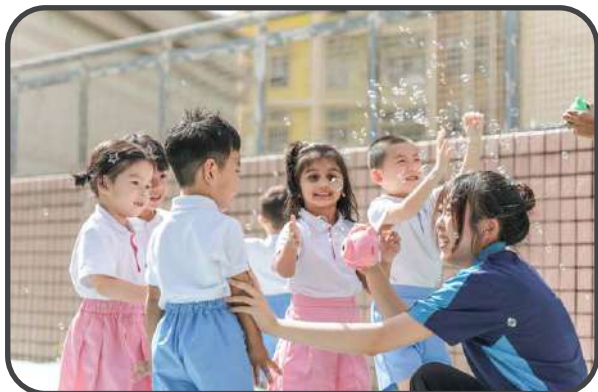
▼ 天台活動一吹泡泡 ▼

科探實驗匯入教室，例如：「水中花」實驗，紙片在水中緩緩綻放，亦在「當萬樂珠遇上可樂」科探中，從「遊戲中學習」不僅激發好奇，更鍛煉邏輯——