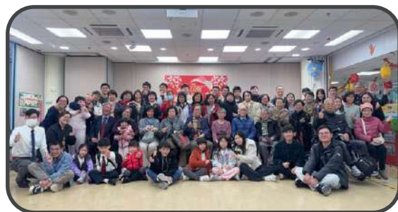
▼ 教會新春愛筵 ▲