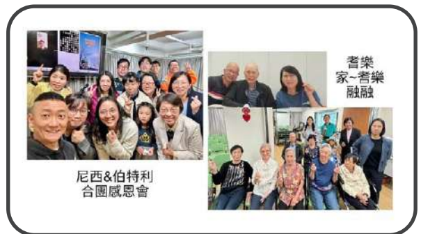
▼ 尼西團、伯特利小組及耆樂家 ▼