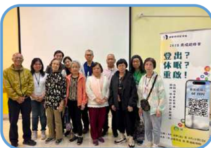
▼ 深水埗堂 ▼