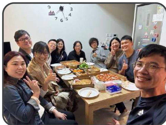
▼ 團友家聚 ▼