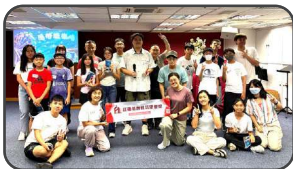
▼ 少年福音營 ▲