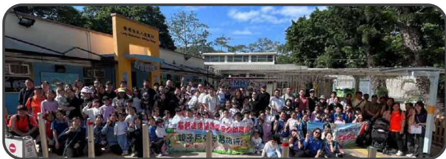
■ 聯校親子大旅行 ■

校監及校長忠心地看守了這片「教育曠野」。如今，神正要帶領教學團隊進入新的服事領域。我們倚靠的不是自己的能力，而是緊緊抓住神的應許。我深信，這 36 年的每一滴汗水，每一次祈禱，神都珍藏；祂必繼續引導前方的路，只要大家謹守教育的核心價值，即使面對學校的變遷，曾播種在孩子生命的聖靈果子必永存在他們心田。