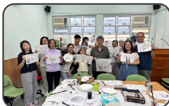
■ 相交主日 - 水墨畫 ■