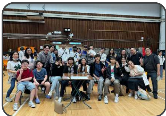
主內一家 - 桌遊日 2025