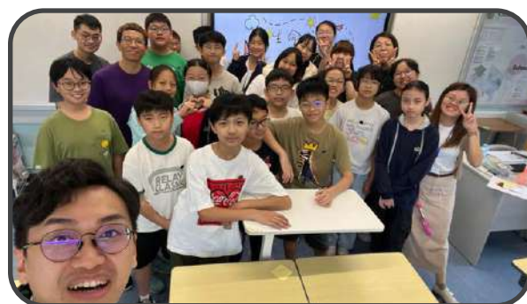
▼ 丘中事工 ▲