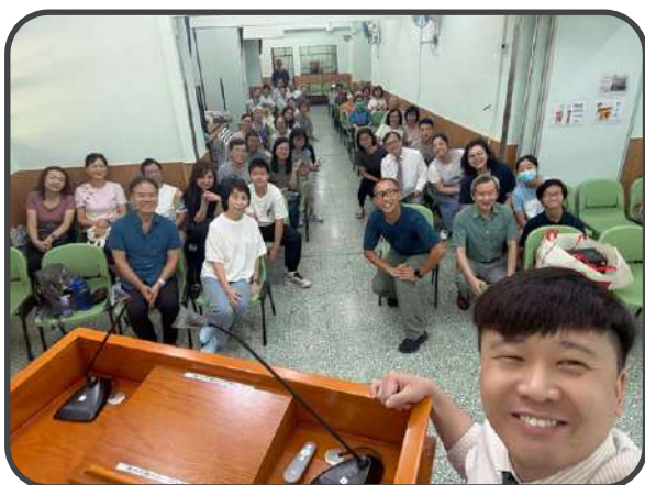
▼ 歡送牧者 ▲