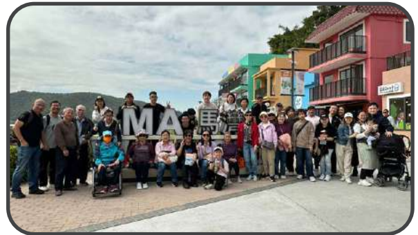
▼ 教會郊遊 ~ 馬灣走走 1868 ▼