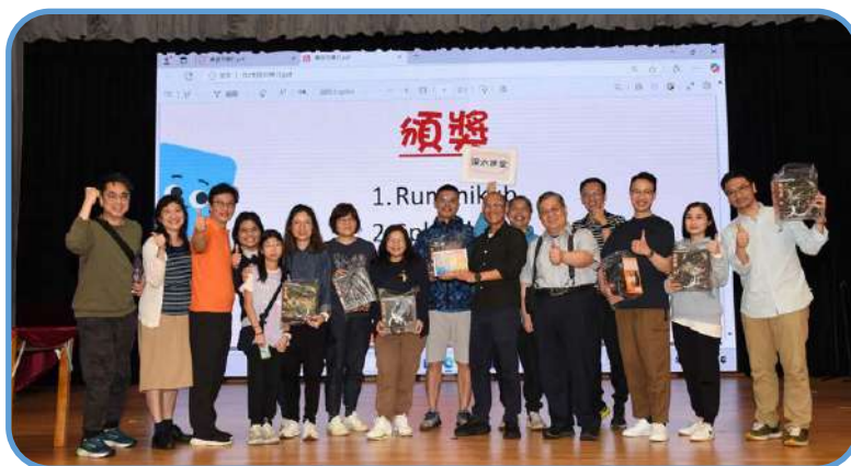
估估劃劃冠軍 - 深水埗堂