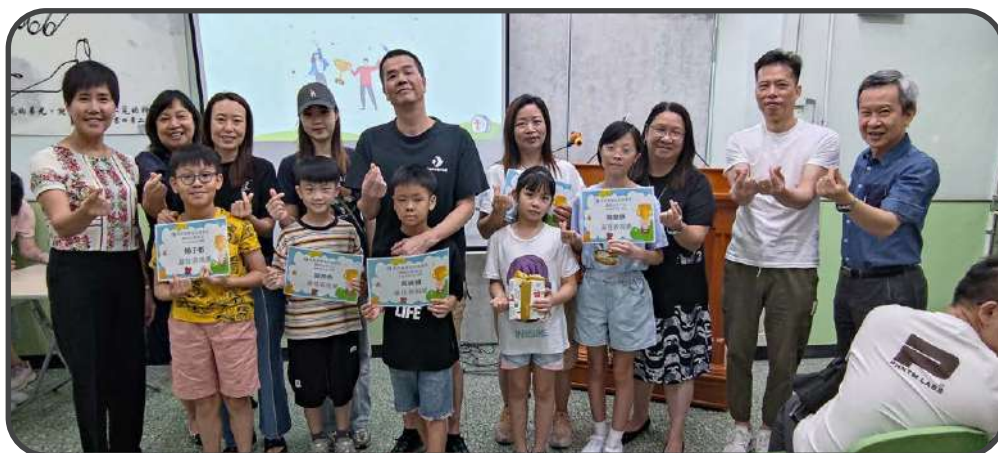
▼ 託管福音主日及頒獎禮 ▲