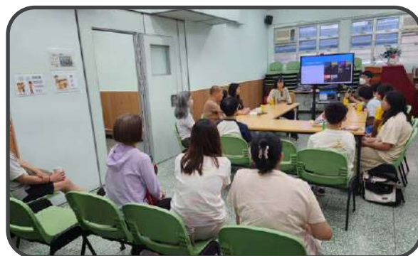
▼ 堅樂事工 - 家長講座 ▲