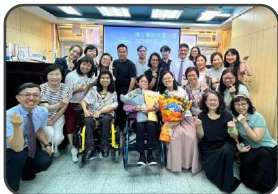
▼ 灑水禮 ▲