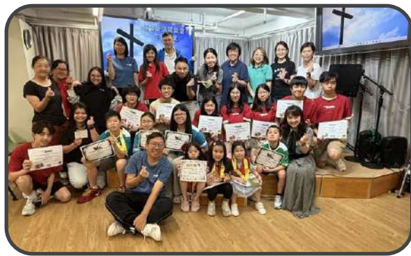
▼ Awana 24-25 年度結業禮 ▲

我們深信彼此連結，同心回應時代的需要，必能見證基督，在挑戰中燃亮生命，成就祂的工。