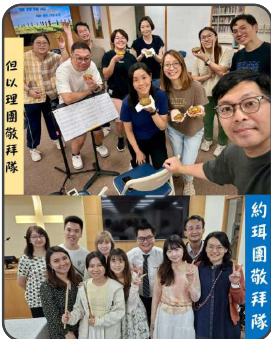
▼ 敬拜隊 ▲