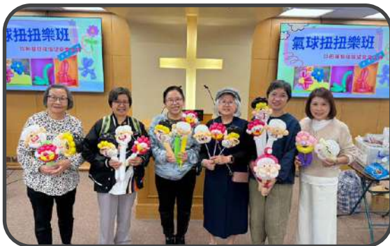
▼ 氣球扭扭樂班 ▲