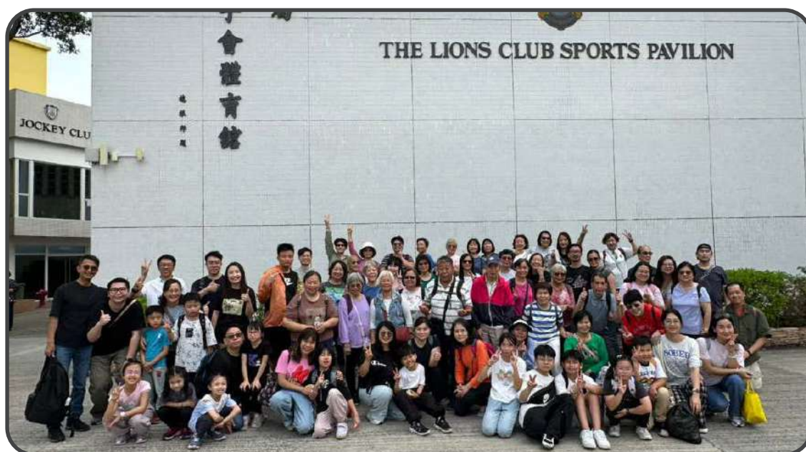
▼ 教會生活日營 ▲