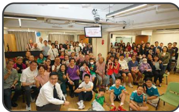
▼ 母親節福音主日 ▼

我們探訪社區的老人院，與樂齡薈和建祝義工隊合辦活動。堂會亦發起「平等分享行動」，弟兄姊妹關注牛頭角區的清潔工、拾荒者和露宿者。帶著物資，以「平等分享」的理念與街坊交流，了解他們的