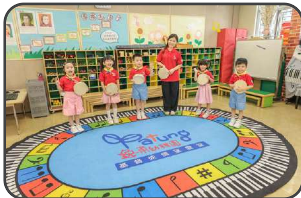
▼ 信望愛合唱團 ▼