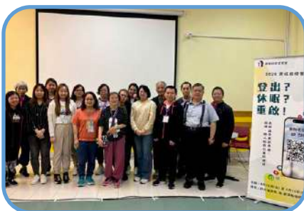
▼ 九龍灣堂 ▼