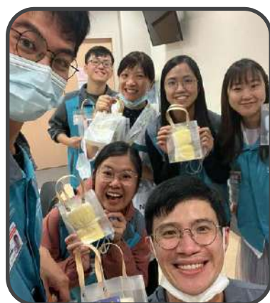
▼ 北大嶼山醫院院牧事工 ▲