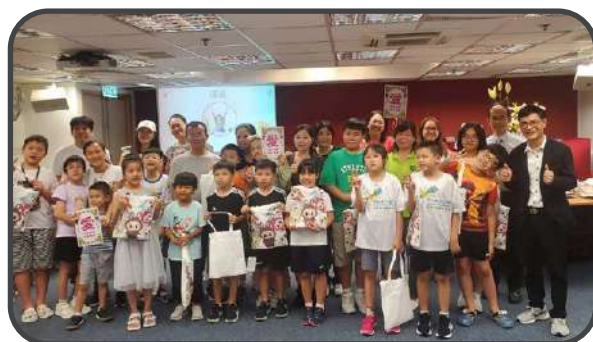
▼ 英語拼音班 ▲