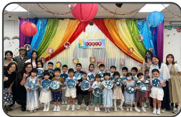
中華文化活動—藍曬