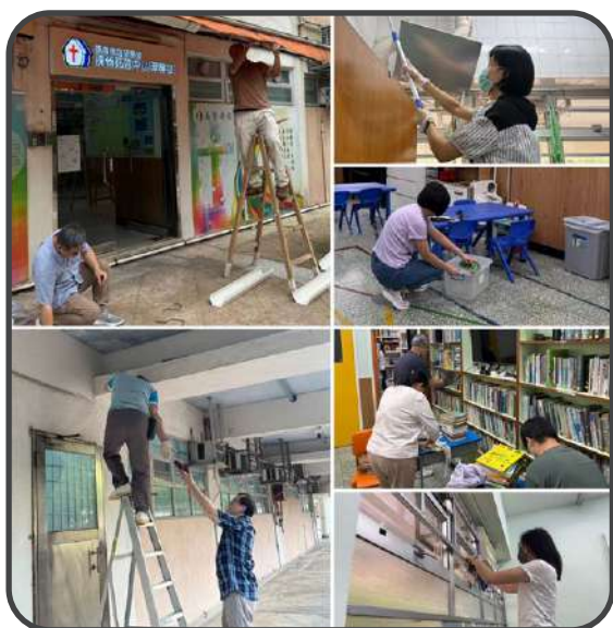
■ 大打掃 ■

十一月亦有人生探索導賞團：埗心安遊。有十六位新朋友和我們一起在石硤尾、深水埗一帶，參觀主教山、美荷樓……等的名勝。