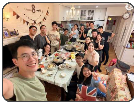
▼ 團友家聚 ▼