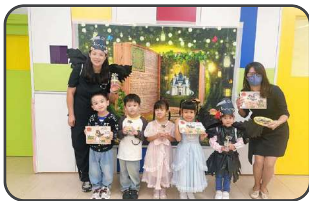
親子故事—烏鴉喝水