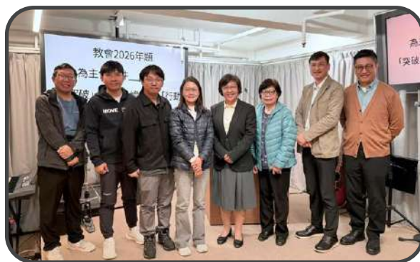
▼ 執事董事同工團隊 ▼

在香港經歷動盪和挑戰的日子，社會瞬息萬變，令人感到迷茫。在紛亂的時代，我們更需要仰望主恩典，彼此提醒，要警醒、堅定信心，一同實踐「連結：與神及與人的連結」，實踐大使命。回顧這一年，若非神信實的保守，我們怎能迎來今天的平安與希望？感謝神，這年中我們經歷了許多美好的聚會和感恩時刻，讓我們不禁讚嘆神的奇妙作為！