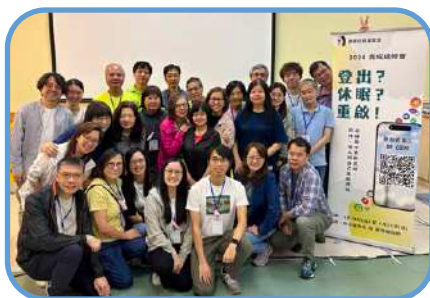
▼ 寶林堂 ▼