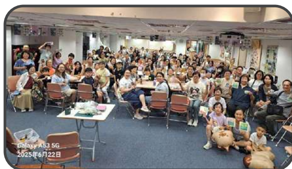
▼ 玩樂空間 ▲