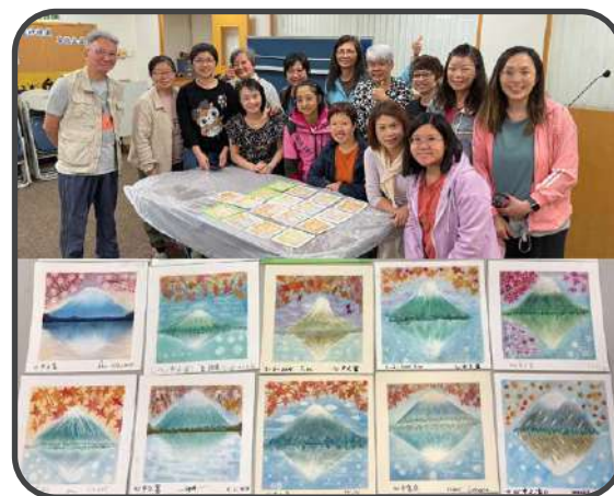
▼ 和諧粉彩班 ▼