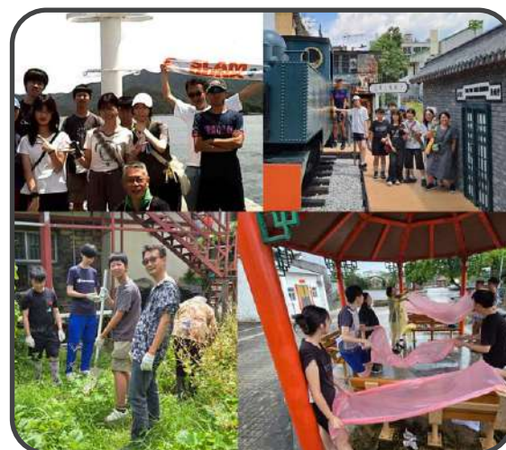
▼ 青少打工換宿生活營 ▼