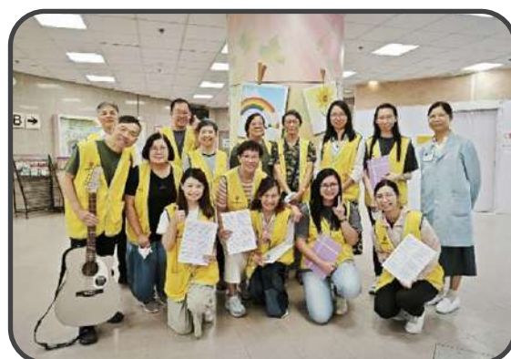
大埔醫院獻唱探訪

全年奉獻金額 (9/2024-8/2025) : $1,088,155 慕道人數 : 5 人