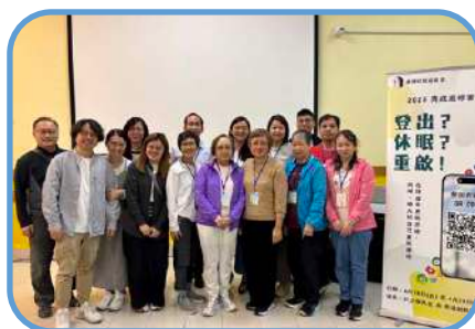
▼ 紅磡堂 ▼

雖然退修會仍有許多地方需要改善，但我們深深感受到三一神的同在與帶領。願我們繼續在敬拜與頌讚中，更新生命，與主同行。