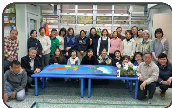
■ 相交活動 - 壁畫製作 ■