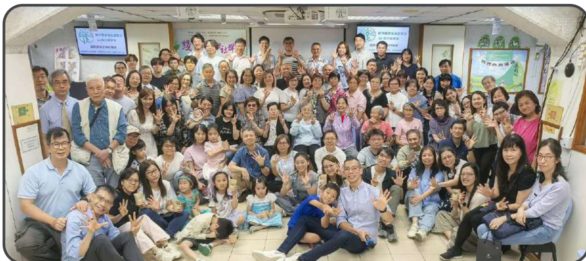
▼ 35 周年感恩聚會 ▲