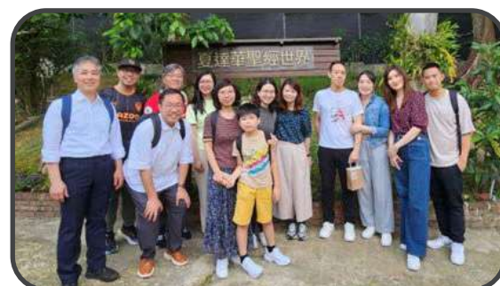
參觀夏達華研道中心文物博物館