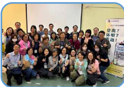
▼ 華明堂 ▼