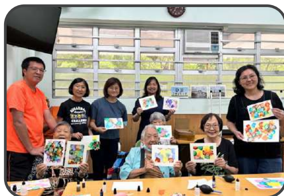
■ 相交主日 - 酒精畫 ■