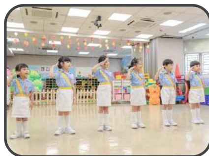
新界南總區第九十六隊 幼兒交通安全隊