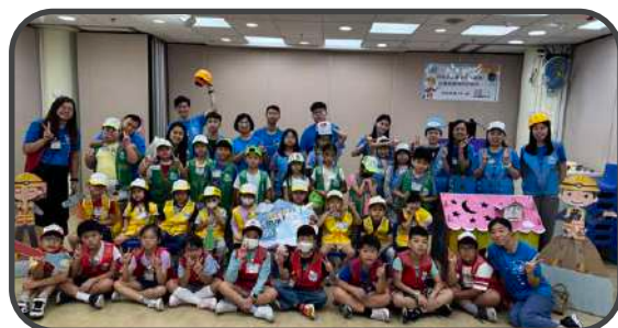
▼ 暑期聖經班 ▲