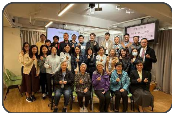
▼ 第二屆會員大會 ▲