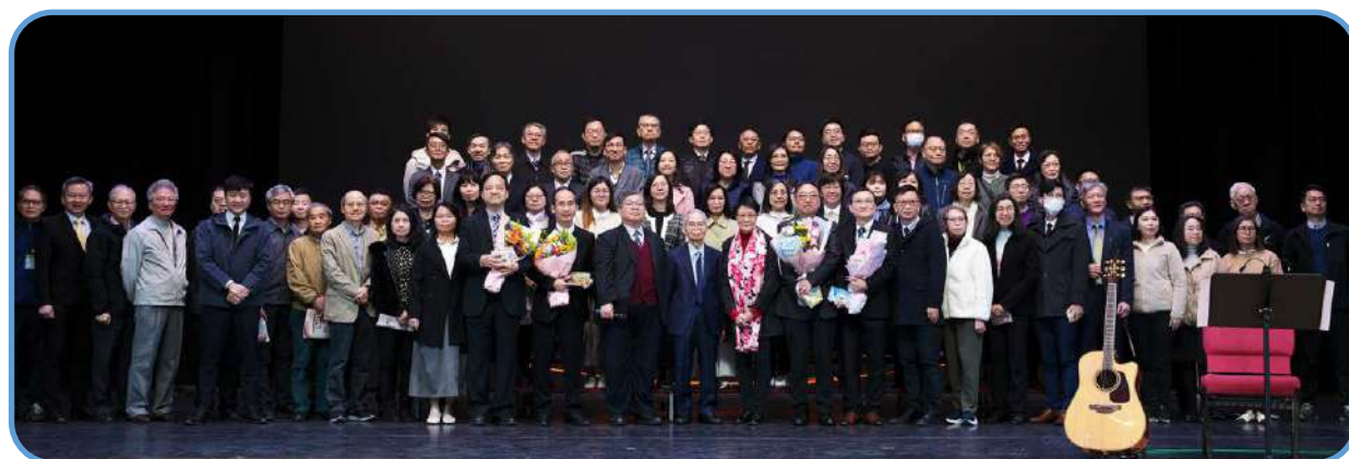
▼ 全體教牧與長執合照 ▲