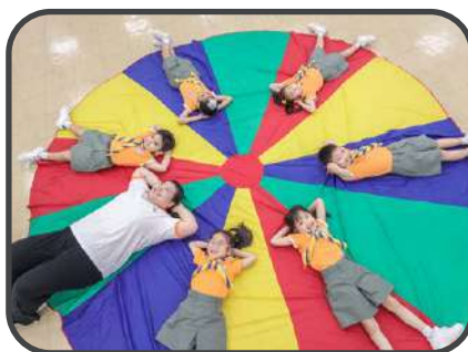
第一六八〇旅小童軍團