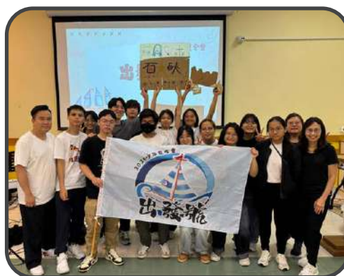
▼ 參加少年夏令會 ▲