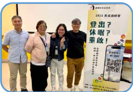
▼ 大埔堂 ▼