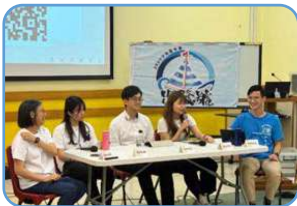
■ 午間聚會：TALK SHOW ■

感恩今年可以再次在少夏服侍弟兄姊妹，全是滿滿的恩典。感恩可以在百忙之中抽空參與，今年又是全新的主題，全新的突破，不論在活動上、敬拜上、信息上，都令弟兄姊妹及自己有很大的得益。感恩弟兄姊妹獻出自己的第一次參與敬拜事奉，看見了火熱事奉的他們，心裏十分鼓舞，也看見他們的用心擺上。午間Talk Show讓我了解到不同的生命故事，看見神在他們身上所行的，感恩遇上了天勤傳道，藉著他的分享，讓我學習如何在職場上做見證，如何為神的國好好裝備自己。感恩今年重辦了久違的寶劍練習，看見了久違的弟兄姊妹努力馬拉松式讀經和討論思考問題。儘管可能有些位置做得不足，但感謝神帶領活動順利進行，又可以令弟兄姊妹重拾對神話語的渴求。感謝神，讓我再一次參與少夏，不論是我或弟兄姊妹，也有很多得著，銘記一生的得著。