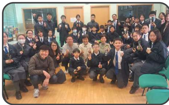
▼ 寧波公學基督徒團契 ▼

在寧波公學事工，我們入校負起基督徒團契，以真理與愛建立中學生。許多學生信主成長，做團契職員、領唱及善用壁報欄傳福音，還有通過話劇和詩歌表達信仰。兩位老師的支持鼓勵學生參加，學生感受到歸屬感。教會舉辦了26項暑假活動，加強了友誼與信任，並在年末開始每月一次教會聚會。看到眾多中學生聚集，願他們的心能更傾向主，歸向神。