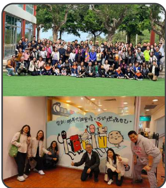
▼ 25 周年戶外崇拜相交日 ▼