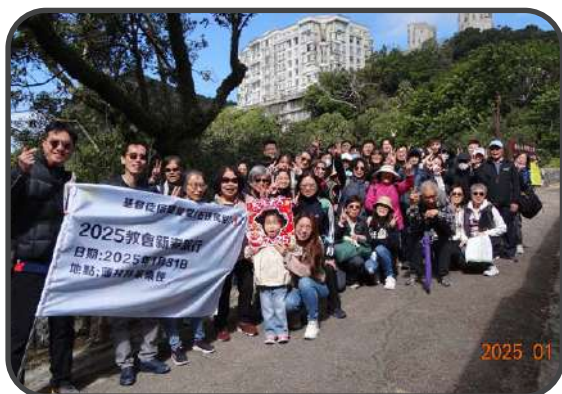
▼ 新春旅行 ▲