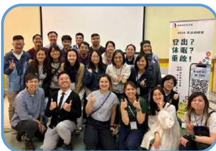
▼ 屯門堂 ▼