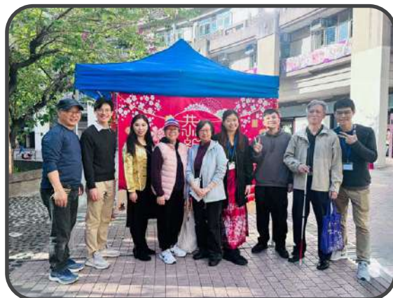
▼ 幼稚園新春嘉年華 ▼