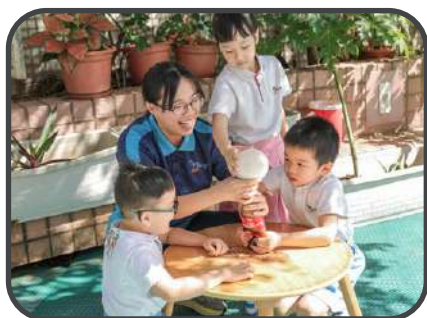
科探活動一當萬樂珠遇上可樂