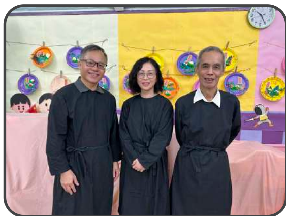
▼ 受浸者 ▲