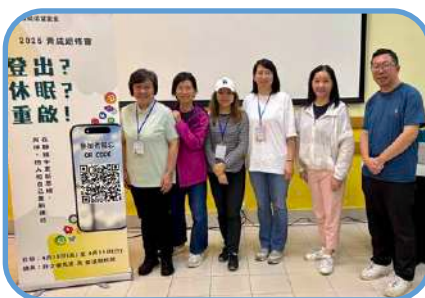
▼ 牛頭角堂 ▼