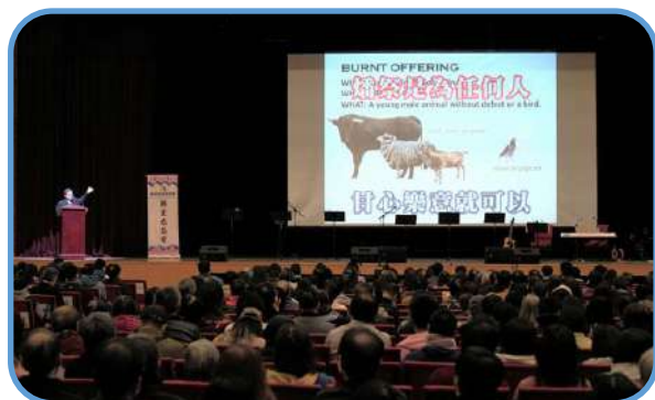
▼ 講道 ▼