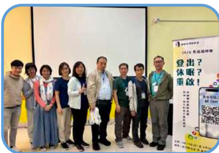
▼ 翠屏堂 ▼