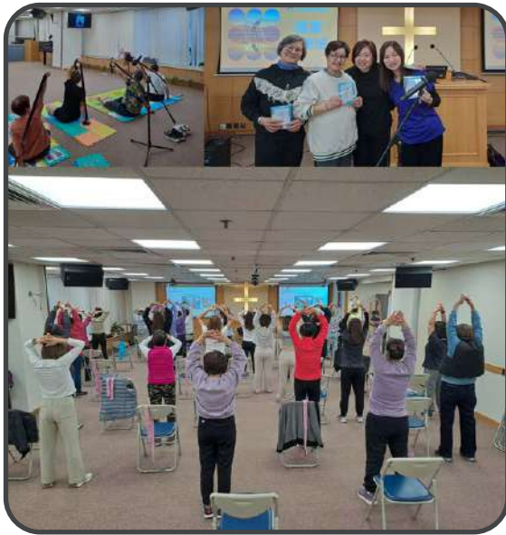
▼ 拉筋班 ▲