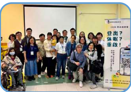
▼ 石硤尾堂 ▼