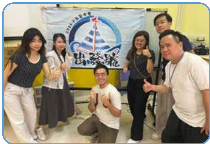
▼ 籌委合照 ▲

感恩今年有機會受邀請成為少夏の籌委，作為一個在教會成長的信二代，參加少夏次數都幾多，但好少考慮籌備一個這麼大型的聚會所需要的資源和時間。今次卻深深體會到每一位信望愛堂的弟兄姊妹在少夏事奉的用心良苦，充滿愛的服侍，和對年青人的關懷。同時亦都好感受到年青人聚會裏面的認真，特別是敬拜，寶劍練習，甚至跳舞的時候都感受到神同在，並且對神有熱烈的回應。雖然都有時候覺得自己做得未夠好，遊戲帶得未夠純熟，但我相信 Practice makes Permanent，多加練習就可以穩定發揮，信心倚靠神及聖靈的帶領。特別感謝其他籌委對我的鼓勵包容，及九龍灣堂的家人對我的支持關心。感謝神！為我之後服侍開了一個不完美，但充分美麗的開頭。將榮耀歸給天上的父親！