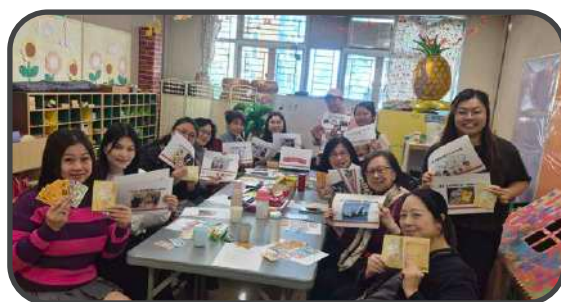
▼ 查經聚會 ▼