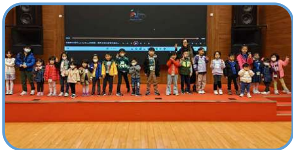
▼ 兒童聚會 ▼