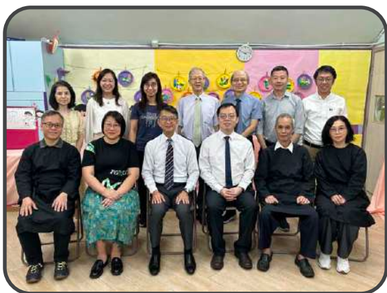
▼ 浸禮 ▲