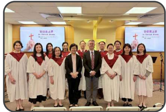
▼ 詩班獻詩 ▲