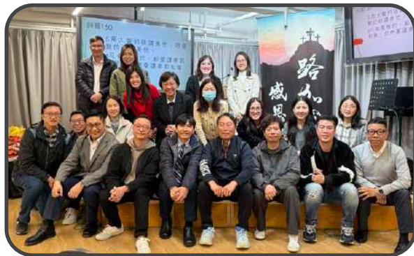
▼ 路加團感恩會 ▲