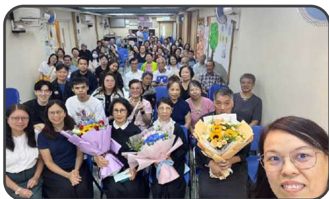
▼ 浸禮 ▲