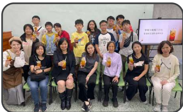
▼ 堅樂事工 - 凍檸茶蠟燭製作 ▲