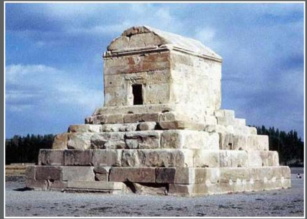
古列王之墓，約主前 559-531 年，位於伊朗中南部，首府為帕薩爾加達（Pasargadae）。

這段歷史清晰地記載在聖經的經文之中，而基督徒考古學家霍爾木茲德·拉薩姆在 1879 年在巴比倫廢墟中發現的「古列銘筒」便是實際的證據，證明它釋放了當年被擄去的猶太人。