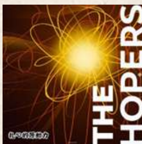
THE HOPERS (適合信徒)