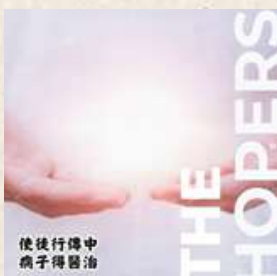
THE HOPERS (適合信徒)